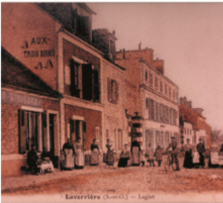
Laverrière (S.-et-O.) — Légiot