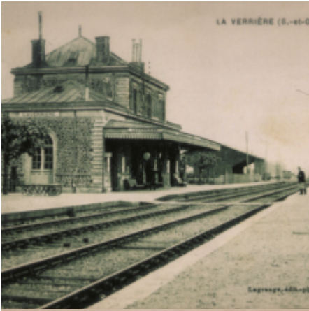
LA VERRIÈRE (S.-et-O.)