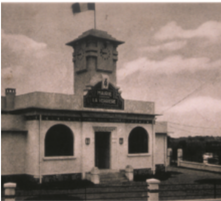
LA VERRIÈRE (S.-et-O.) — La Motte