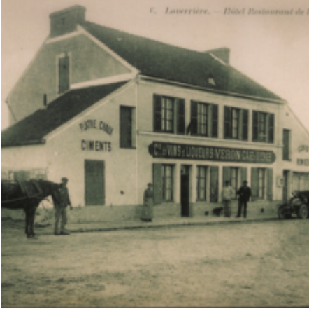
C. Laverrière. — Hôtel Restaurant de